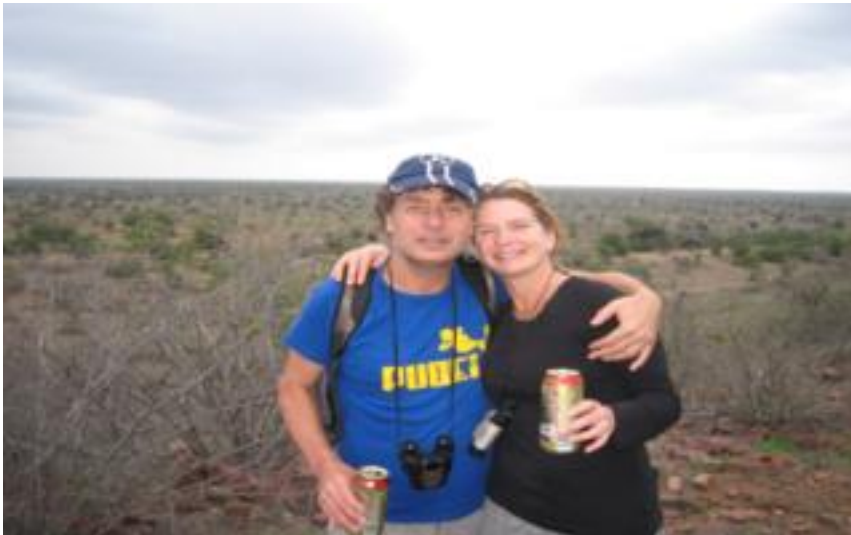
Swenitrail < Kruger Nationaal Park