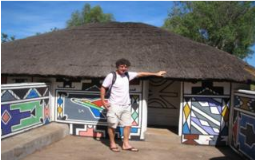
Het Nbedele dorpl igt ca. 10 km boven Middelburg, Botshabelo. Is best de moeite waard.