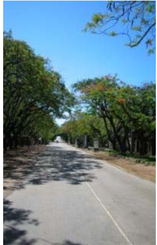
Komatipoort, Rissikstraat (hoofdstraat)